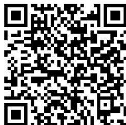
World Relief List