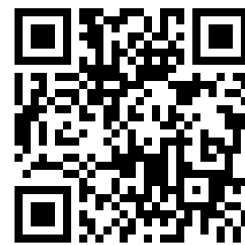
Welcome to IL